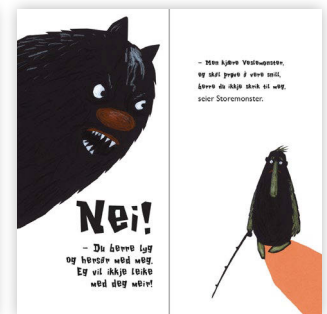
Oppslag 12 der Veslemonster framstilles stor, han er den som har overtatt makten.