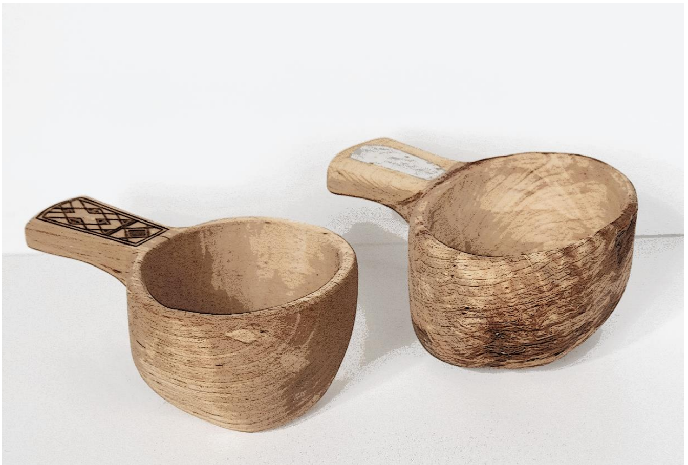
Guksi - Samisk turkopp