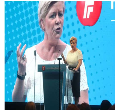
RIDT: – Jeg har aldri beklaget at jeg bruker begre..